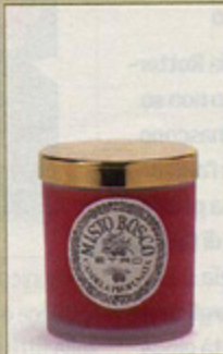
Misto bosco Eto