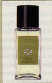
Acqua di Biella Calé