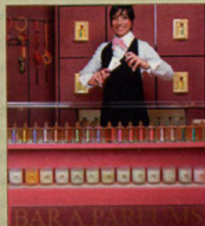
Il Bar à parfums di Milano L'artisan parfumeur