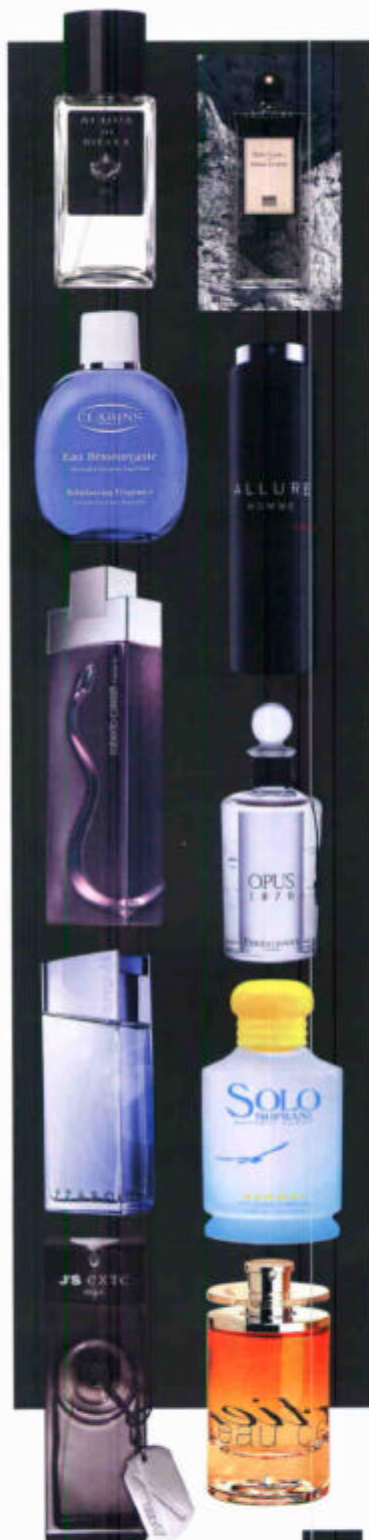
Da sinistra e dall'alto, Acqua di Biella, 1871. Gris Clair di Serge Lutens. Eau Dynamisante di Clarins. Allure Homme Sport Spray di Chanel. Roberto Cavalli Black. Opus 1870 di Penhaligon's. Bright Visit di Azzaro. Solo Soprani Summer di Luciano Soprani. J'S Exté Man, Eau de Cartier.

I capelli si possono facilmente tenere a bada con BC Bonacure Hairtherapy di Schwarzkopf Professional (acquistabile presso i saloni di acconciatura), che offre shampoo e doposhampoo per la cura e l'igiene quotidiana suddivisi in quattro linee: Vitalizzante, Prevenzione Caduta, Controllo Forfora e Effetto Idratante. A proposito di forfora, provare il nuovo shampoo trattante Elvive Antiforfora Intensivo de L'Oréal Paris , che libera i capelli dal problema fin dal primo giorno di utilizzo. E per dare nuovo slancio ai capelli divenuti più deboli e fragili con il trascorrere dell'età, indicato lo Shampoo Fortificante & Anti-Ageing Speciale Uomo di Foltène .