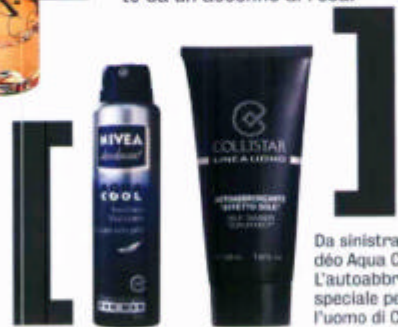
Da sinistra. Il nuovo déo Aqua Cool di Nivea. L'autoabbronzante speciale per l'uomo di Collistar.